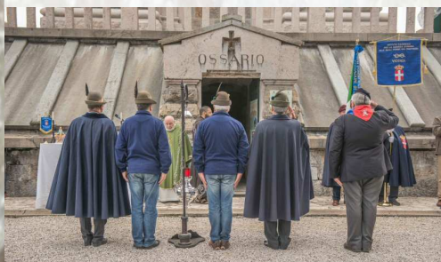
Ossario del Pasubio

Nasce dal desiderio di portare questo segno di luce e pace nei quattro luoghi simbolo della Grande Guerra, i quattro sacrari militari della provincia di Vicenza: Pasubio, Grappa, Tonezza e Asiago.