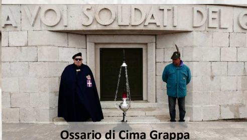
Ossario di Cima Grappa

Ancora oggi questo luogo è punto di riferimento per le gioie e per le paure di tutti i Vicentini.