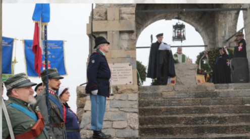
Ossario di Tonezza del Cimone

è stata portata il primo anno al Sacrario del Pasubio, nel 2015 a Cima Grappa e nel 2016 a Tonezza del Cimone. Nel gennaio del 2016 è stata portata a Roma, all'Altare della Patria, dove nel 1921 furono accolte le spoglie del Milite Ignoto. Quarta ed ultima tappa del suo pellegrinaggio sarà l'Ossario di Asiago nel 2017.